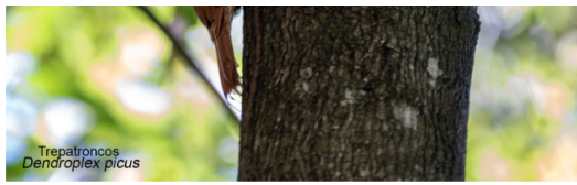
Treatroncos Dendroplex picus