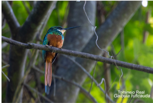
Tomineio Real Galbula ruficauda