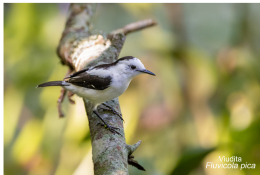
Viudita Fluvicola pica