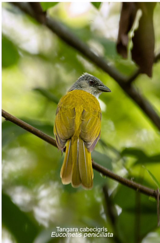
Tangara cabecigris Eucometis penicillata