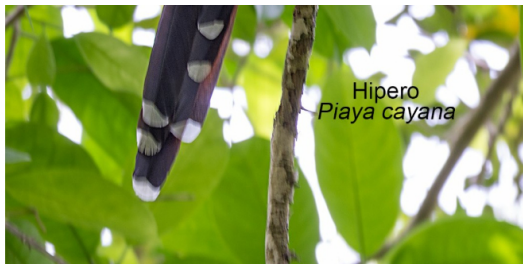
Hipero Piaya cayana