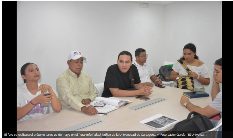
El foro se realizará el próximo lunes 20 de mayo en el Paraninfo Rafael Núñez de la Universidad de Cartagena. // Foto: Javier García - El Universal

Estudiantes y maestros de la Universidad de Cartagena organizaron un foro para debatir las problemáticas de la institución, como la deuda a Ecopetrol.