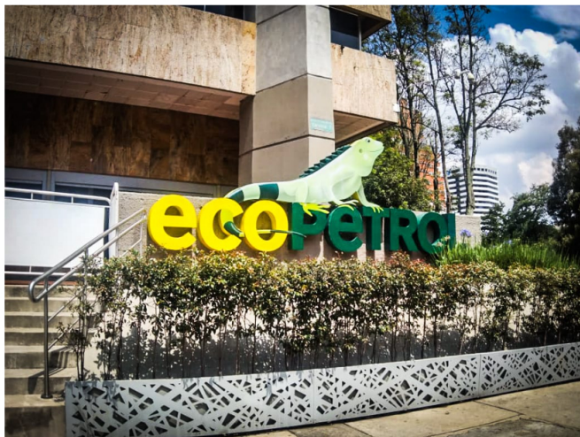
ECOPETROL SOLO bajó sus utilidades por un hecho: Hace un año el dólar estaba a 4700 y hoy a 3900.

En la carta de carácter público, los exfuncionarios dicen que las palabras del presidente “dificultan su posicionamiento internacional y el acceso a mercados y a potenciales socios”