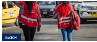
NACIÓN Manifestaciones 15 de mayo: conozca el estado de la movilidad