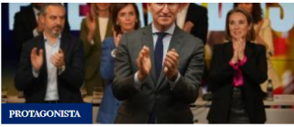
PROTAGONISTA Alberto Núñez Feijóo