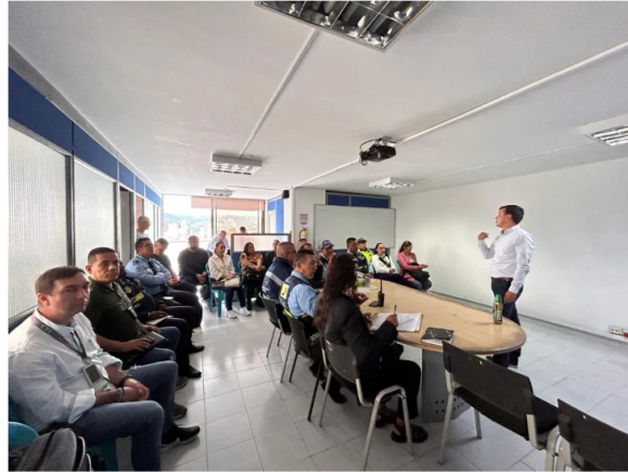
Capacitación a las principales autoridades encargadas del manejo de este dispositivo.