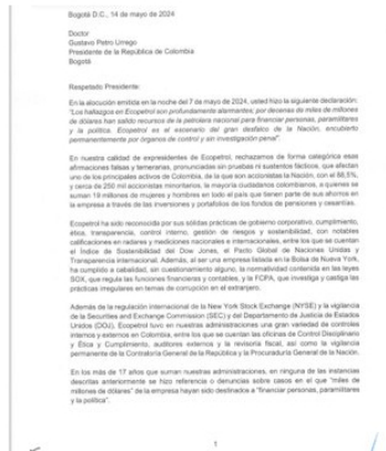
La carta al presidente Petro X

“La articulación de funcionarios de Ecopetrol y el paramilitarismo es un proceso judicial en curso en la JEP que el gobierno apoya como es su deber”.