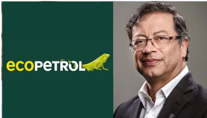
El presidente de Ecopetrol , advirtió las consecuencias negativas que tendría prohibir el fracking en los bolsillos de los colombianos.

han crecido, esto no ha traído buenos frutos a la compañía, que ha registrado pérdidas en las utilidades durante los últimos meses.