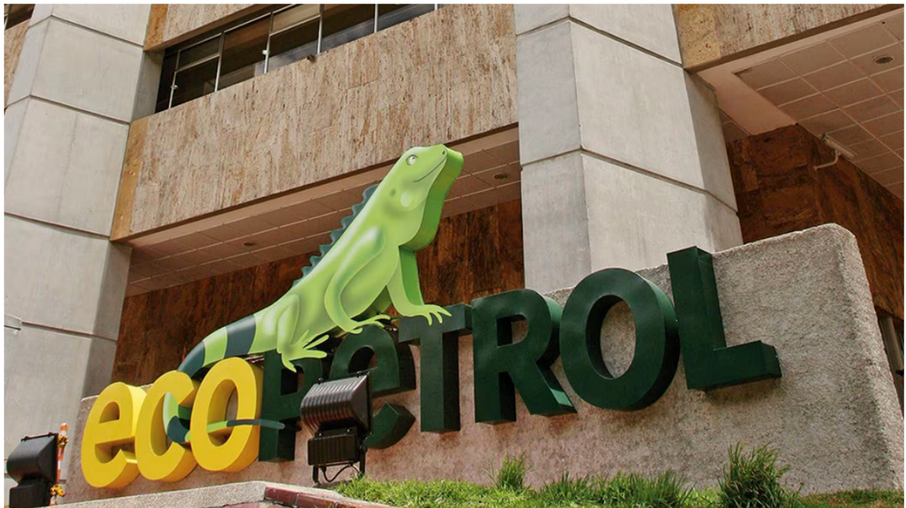
Tras los cambios en los estatutos de Ecopetrol , el nuevo Gobierno, al parecer, convocará a una asamblea extraordinaria para volverlos a modificar y poder designar su junta directiva.

Ecopetrol es la empresa más grande e importante del país, la cual se dedica al negocio del petróleo, que es uno de los que más irriga divisas sobre las finanzas nacionales al exportar millones de barriles del hidrocarburo a otros países. Sin embargo, con la llegada del Gobierno Petro, todo cambió sustancialmente para la compañía.