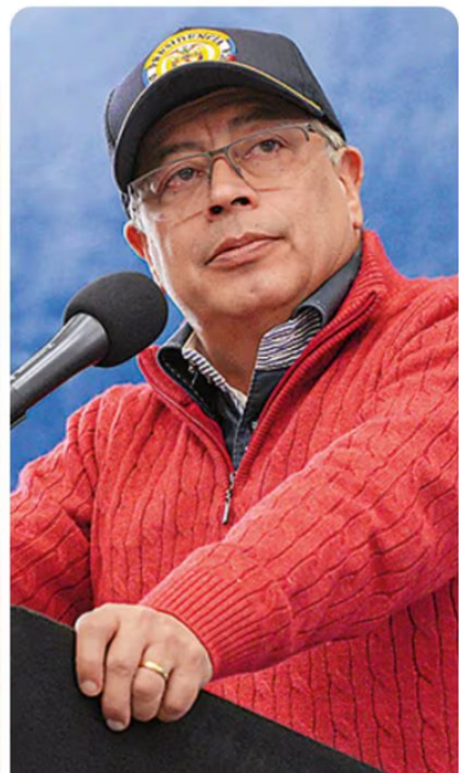
El presidente de Ecopetrol, Ricardo Roa, y el presidente de Colombia, Gustavo Petro.

La investigación por una posible violación de topes en la campaña que llevó a Gustavo Petro a la presidencia de la República en 2022 sigue generando polémica en el país, en la medida que se conocen más hechos que vinculan, especialmente, al actual presidente de Ecopetrol, Ricardo Roa, quien para ese entonces se desempeñó como gerente de la campaña.