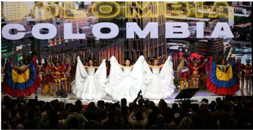
Celebración del triunfo de Gustavo Petro en Movistar Arena

De estas facturas “se determina que no fueron anuladas, por tal motivo, se infiere que los bienes y servicios allí relacionados se prestaron en su totalidad a la campaña presidencial de segunda vuelta de la coalición del Pacto Histórico, razón por la cual se debió registrar en el informe de ingresos y gastos la segunda factura por valor de 100 millones de pesos, que se pagó a la empresa TBL Live S.A.S., en la medida que se trataba del mismo evento”, señala el documento.