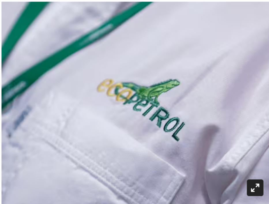
Camiseta con el logo de Ecopetrol .

La SIC identificó presuntos 'pliegos sastre' en procesos de selección para la prestación de servicios de transporte por más de $417.000 millones.