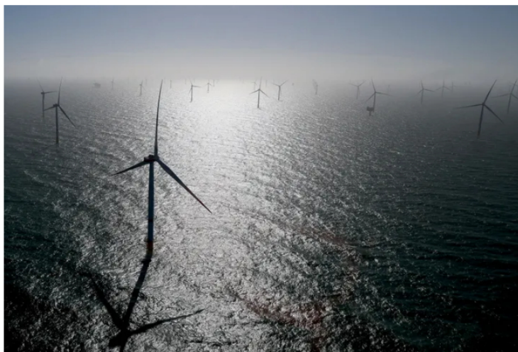
FOTO DE ARCHIVO: Colombia realizará una licitación de energía eólica offshore.