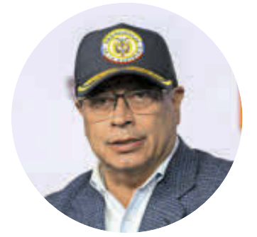
GUSTAVO PETRO Presidente de la República