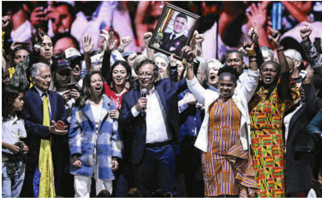
Celebración en el coliseo Movistar Arena de Bogotá de la campaña Petro Presidente el 19 de junio de 2022, cuando vencieron en segunda al candidato Rodolfo Hernández.

Sobre los vuelos con esta empresa, la ponencia advierte que no se habrían reportado los pagos por $1.249 millones