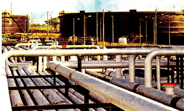
Panorámica de infraestructura de Ocesa.

Agregó, que en cuanto a los alimentos balanceados para animales, los precios continuaron, también, con tendencia a la baja, registrando una reducción del 3,67% en el primer trimestre de 2024 beneficiando a los productores pecuarios, al reducir sus costos en este rubro. ☺