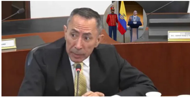
Roa declaró el pasado 18 de abril ante la Comisión de Acusación.

El presidente de Ecopetrol, y quien estuvo al frente de la campaña de Gustavo Petro, respondió a los cuestionamientos en la comisión.