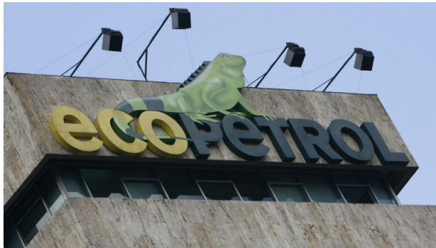
Fotografía de archivo en la que se registró un logo de la petrolera estatal colombiana Ecopetrol, en Bogotá (Colombia).

Compartir: Facebook Twitter WhatsApp Comentarios