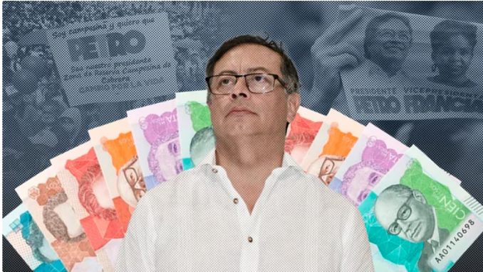
Las discrepancias entre los ingresos y gastos reportados en la campaña presidencial de Gustavo Petro pusieron el tema bajo la lupa, esta vez, del CNE