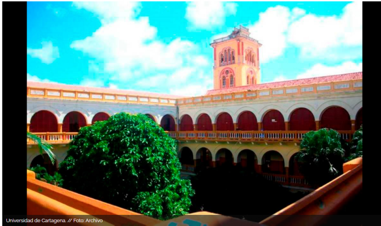
Universidad de Cartagena.

El ministro de Justicia, Néstor Osuna, aseguró que presentarán un proyecto de ley ante el Congreso para que se perdone la deuda de la UdeC.