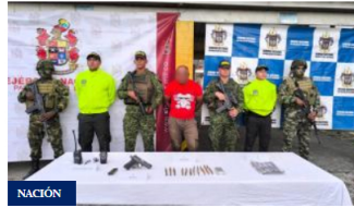
NACIÓN Capturan a alias 'Firulais' cabecilla del Clan del Golfo en Chocó