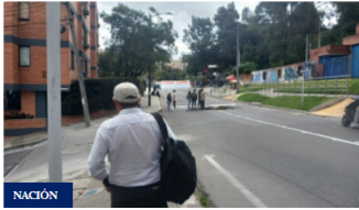
NACIÓN Bloqueos este 8 de mayo: conozca el estado de movilidad en Bogotá