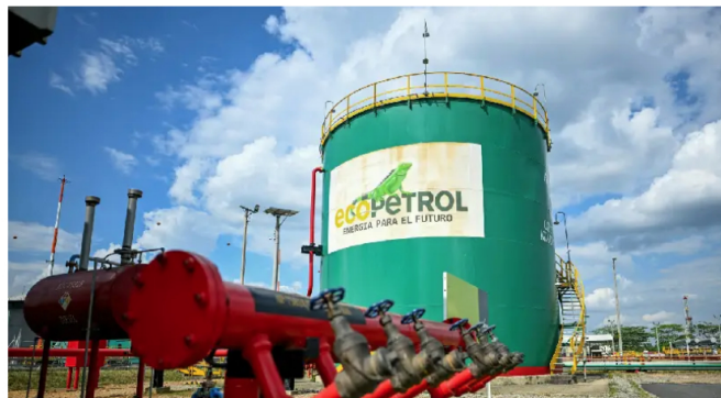
LA PETROLERA disminuyó sus utilidades entre enero y marzo de este año.

Se espera para este año mejorar la producción de crudo.