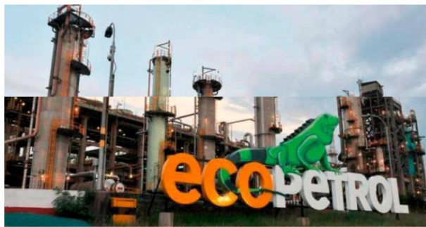
Las acciones de Ecopetrol caen 1,76% en la BVC tras desplomarse su utilidad un 29,1% en el primer trimestre de 2024.

A pesar de la caída en la utilidad, Ecopetrol aumentó sus volúmenes de producción y diversificó su portafolio con la inauguración de una granja solar.