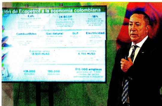
Ricardo Roa, presidente de Ecopetrol, anunció que la compañía aumentó su meta de producción de hidrocarburos para 2024.

Pese a que en el primer trimestre de 2024 las ganancias de Ecopetrol cayeron 29,1 por ciento al sumar 4 billones de pesos, su presidente, Ricardo Roa, destacó que la operación de la compañía va por un buen camino. Además, aseguró que están en la etapa final para adquirir el parque eólico Windpeshi en La Guajira y que la rehabilitación del gasoducto para importar gas desde Venezuela podría costar hasta 40 millones de dólares.