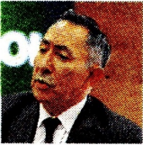
RICARDO ROA PRESIDENTE DE ECOPETROL

Tras los resultados de la actividad económica de Ecopetrol para el primer trimestre del año, y además de una caída de 10,5% en las utilidades en comparación con 2023, el CNE evaluará si investigará la campaña Petro , de la que Roa fue gerente.