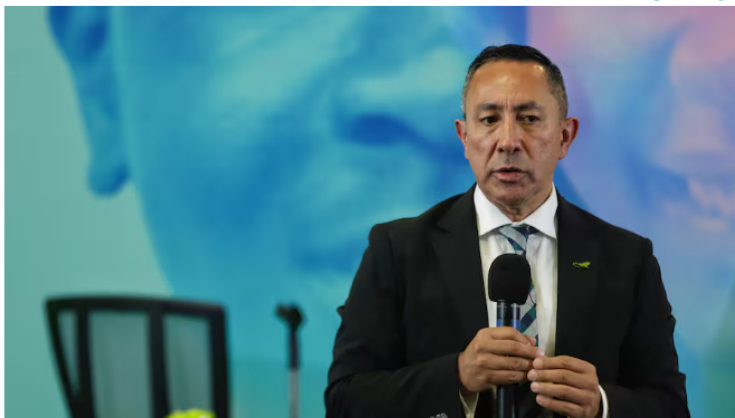
Ricardo Roa, presidente Ecopetrol , entrega los detalles de operación en el primer trimestre de 2024.

Compartir El presidente de Ecopetrol , Ricardo Roa, entregó los resultados de operación de Ecopetrol para el primer trimestre de 2024.