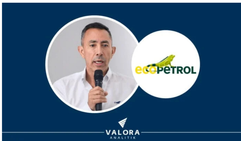
El presidente de Ecopetrol , Ricardo Roa.

Ecopetrol reportó ventas totales por $31,3 billones en el primer trimestre de 2024, según su reporte de resultados, lo que equivale a una caída del 19,4 % frente al mismo periodo del 2023.