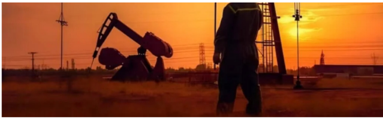
Producción de petróleo en Colombia.

Y agregó: “Resaltamos la comercialidad del campo de gas Arrecife ubicado en el Departamento de Córdoba, así como la firma del acuerdo de exploración de gas en el Piedemonte Norte con Parex, lo que amplía la oferta de gas en el país”.