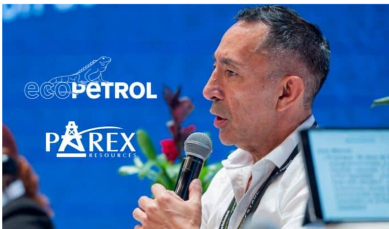
Ricardo Roa, presidente de Ecopetrol .

El presidente de Ecopetrol , Ricardo Roa, anunció este martes que la compañía ha decidido aumentar su meta de producción de hidrocarburos para 2024.