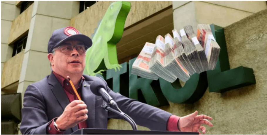
El presidente Petro habló sobre entidades del Estado como Ecopetrol , en una red de corrupción.

En alocución presidencial, el presidente Petro reveló hallazgos en la red de corrupción que existiría entre algunas entidades públicas.