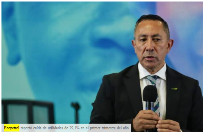
Ecopetrol reportó caída de utilidades de 29,1% en el primer trimestre del año

LOCAL Nita Local about 10 hours ago REPORT