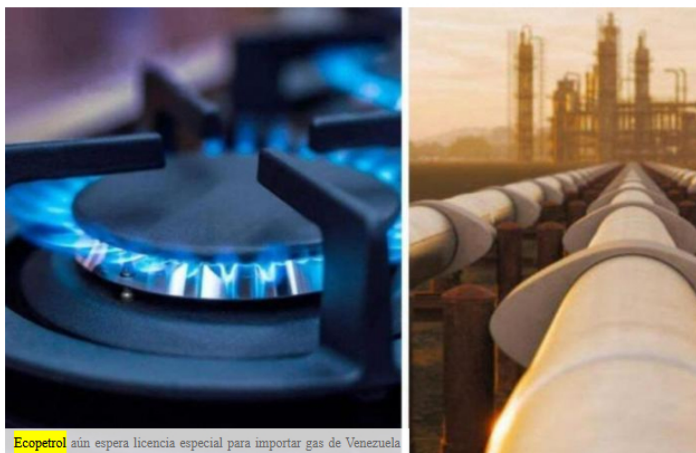
Ecopetrol aún espera licencia especial para importar gas de Venezuela

TRENDS Letha Trend about 9 hours ago REPORT