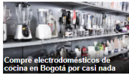
Compre electrodomésticos de cocina en Bogotá por casi nada