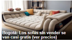
Bogotá: Los sofás sin vender se van casi gratis (ver precios)