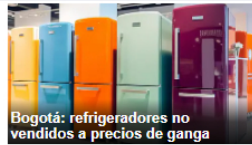
Bogotá: refrigeradores no vendidos a precios de ganga