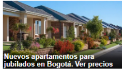
Nuevos apartamentos para jubilados en Bogotá. Ver precios