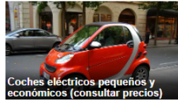
Coches eléctricos pequeños y económicos (consultar precios)