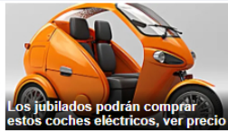
Los jubilados podrán comprar estos coches eléctricos, ver precio