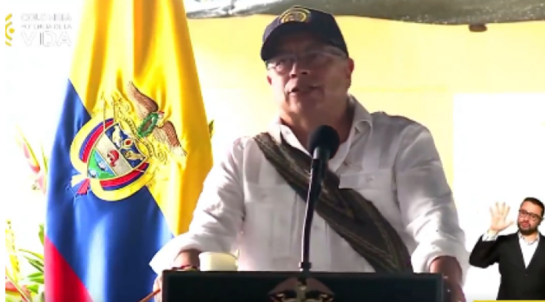
Presidente Petro en el Cesar

Publicado: Miércoles, Mayo 8, 2024 - 00:36 | Actualizado: Miércoles, Mayo 8, 2024 - 00:37