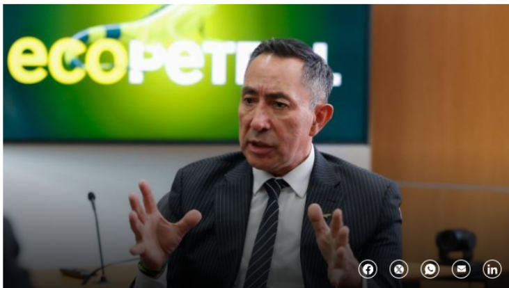
Ricardo Roa presidente de Ecopetrol

No obstante, destacó que el Grupo Ecopetrol logró afrontar este entorno "con resiliencia operativa, apoyado en su diversificación de mercados, la maximización de eficiencias, optimización y ahorros en las operaciones, logrando así resultados favorables y generando un nivel de rentabilidad competitiva en la industria".