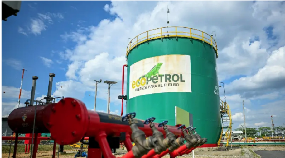
LA PETROLERA disminuyó sus utilidades entre enero y marzo de este año.

Se espera para este año mejorar la producción de crudo.