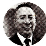
Ricardo Roa Presidente de Ecopetrol

"Hemos navegado en un entorno impactado por variables como el aumento en los costos de energía, inflación, revaluación del peso colombiano y menores precios de productos refinados".