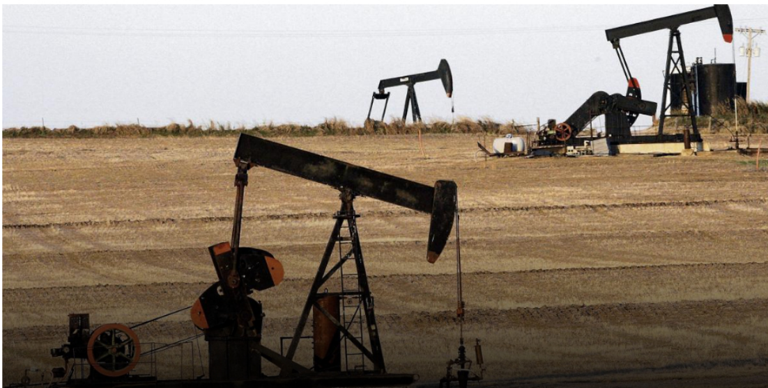
El consumo mundial de petróleo en 2023 superó los 102 millones de barriles diarios.

El contrato tendrá una vigencia de tres años, con un precio aproximado de 3,045 dólares por barril.