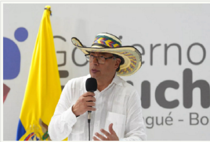
EL PRESIDENTE DE COLOMBIA GUSTAVO PETRO.

Por: Prensa Latina | Domingo, 05/05/2024 11:14 AM | Versión para imprimir