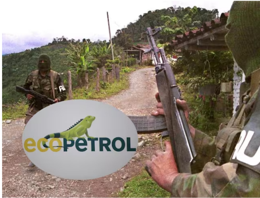
Ecopetrol y AUC.

La magistratura requirió copia de numerosos contratos de personas que fueron señaladas ante Justicia y Paz de trabajar con las AUC, así como de otras que fueron señaladas por José Eduardo González, uno de los testigos estrellas.