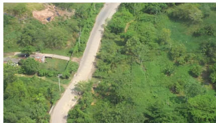
En la construcción de este proyecto serán vinculados 100 trabajadores.

Los trabajos, que comenzarán el próximo 20 de mayo, estarán a cargo de la empresa Servicios Industriales Barrancabermeja S.A.S (Serinb S.A.S), aliada que prevé la vinculación de 100 trabajadores, y contarán con la interventoría de la firma Velneq S.A. Su terminación está programada para el mes de octubre de 2024.