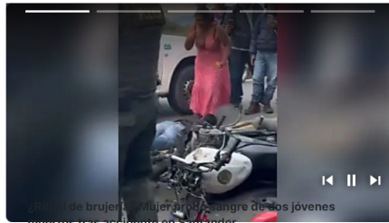
Video de bruja y mujer por el sangre de dos jóvenes muertos tras accidente en Santander

Los trabajos, que comenzarán el próximo 20 de mayo, estarán a cargo de la empresa Servicios Industriales Barrancabermeja S.A.S (Serinb S.A.S), aliada que prevé la vinculación de 100 trabajadores, y contarán con la interventoría de la firma Velneq S.A. Su terminación está programada para el mes de octubre de 2024.