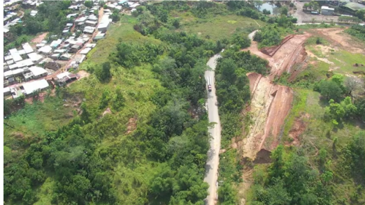
Más de $15 mil millones es el costo de la obra que ejecutan el Inviás, el Departamento de Santander, el Distrito de Barrancabermeja y Ecopetrol.

Más de $15 mil millones es el costo de la obra que ejecutan el Inviás, el departamento de Santander, el Distrito de Barrancabermeja y Ecopetrol.