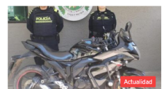
La Policía Nacional capturó en las últimas 24 horas a doce personas y logró la