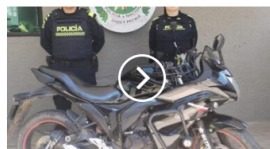
La Policía Nacional capturó en las últimas 24 horas a doce personas y logró la incautación de un arma de fuego, cuatro mil doscientas dosis de estupefacientes, así como la recuperación de siete automotores.