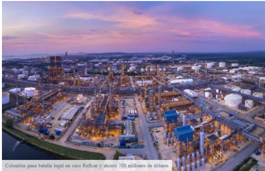
Colombia gana batalla legal en caso Reficar y ahorró 700 millones de dólares