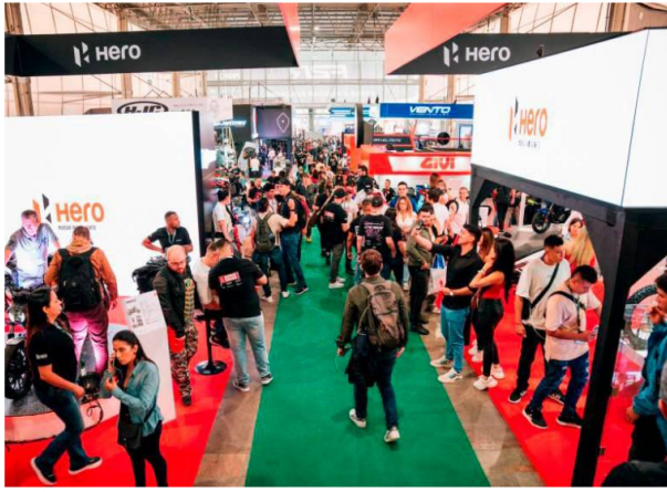
En la Feria de las Dos Ruedas participan más de 450 expositores y están programados 107 eventos.

El evento se celebra hasta el domingo, 5 de mayo, en Plaza Mayor, Medellín.