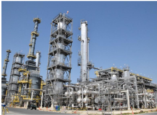
En 2022, Reficar aumentó su capacidad de producción de 150.000 a más de 200.000 barriles por día (bpd) para atender la creciente demanda nacional de combustibles.

“Si bien el proyecto tuvo bastantes dificultades y sobrecostos, ante los cuales se han dado múltiples discusiones y se tuvieron muchos aprendizajes para el desarrollo futuro de proyectos de esta naturaleza y magnitud, que se hayan presentado las acciones judiciales respectivas en contra del contratista y obtener fallos favorables a favor de Ecopetrol, que finalmente se traduzcan en un menor costo del proyecto y un ahorro para la empresa y a la Nación , es una excelente noticia”, declaró Vera.