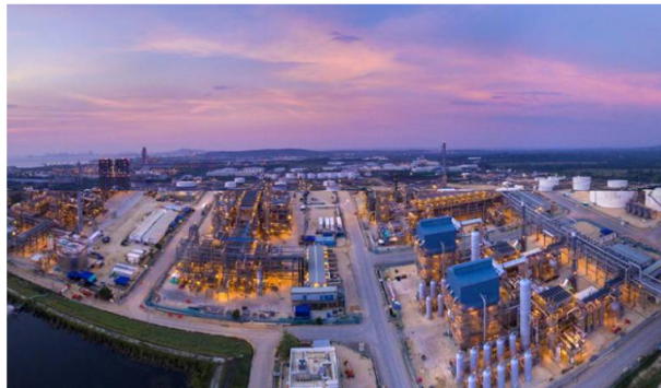
Colombia descontinúa arbitraje con CB&I UK en caso Reficar, evitando un costoso pago.

Colombia logra descontinuar arbitraje con CB&I UK por caso Reficar, ahorrando 700 millones de dólares.