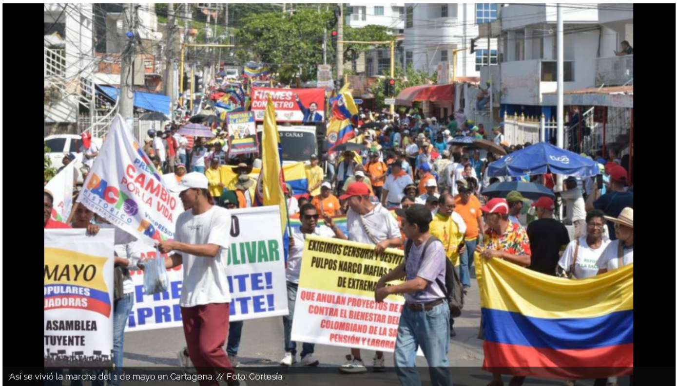
Así se vivió la marcha del 1 de mayo en Cartagena.

En conmemoración del Día del Trabajo, diferentes sindicatos salieron a marchar en defensa de la clase obrera. También hubo apoyo a las reformas del Gobierno nacional.