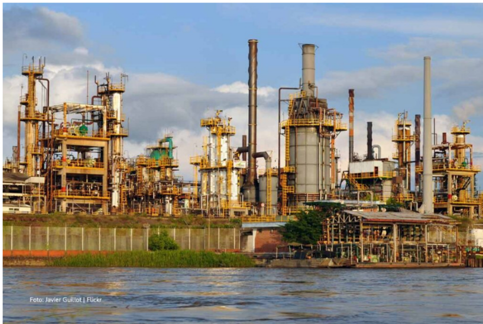
Preocupación en sectores energéticos por plan de importación de gas de Venezuela 3

El PISE buscaría, por un lado, acelerar el desarrollo de reservas de gas costa afuera para incrementar la oferta local en el corto y mediano plazo. Por el otro, buscaría habilitar diversas fuentes de suministro externas, como la interconexión regional y la infraestructura de regasificación, para mantener la seguridad energética y la confiabilidad del servicio.