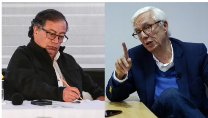
Jorge Robledo le respondió al presidente Gustavo Petro que no puso a un trabajador de Ecopetrol en la junta directiva

Desde que el viernes 22 de marzo se dio a conocer la nueva junta directiva de Ecopetrol, se han generado todo tipo de comentarios y críticas a los miembros que la integran, que son nueve en total. En uno de los mensajes al respecto más recientes el excongresista Jorge Robledo por medio de su cuenta de X arremetió en contra del presidente Gustavo Petro, debido a que una de las personas que lideraran la empresa nacional es integrante de la administración pública del jefe de Estado, por lo cual el político dudó de su independencia.