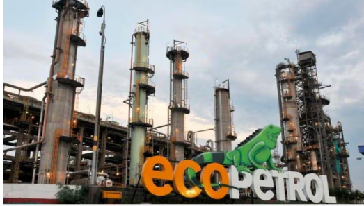
La acción que más se desvaloriza en la jornada de hoy es la de Canacol que cae 9,54 %, seguida por el título de Ecopetrol, con una caída de 4,49 %.

Ecopetrol registra una caída del -5 %, ya que hoy marca el inicio del período exdividendo de la primera cuota del dividendo, que asciende a $156 por acción, después de la aprobación de los cambios en sus estatutos en la pasada Asamblea del 22 de marzo.