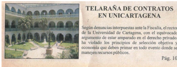
Facsimil de la edición No. 3 de Revista El Metro de julio de 2005

La Universidad de Cartagena perdió su norte y la perversa utilización de la figura de los contratos interadministrativos la convirtió en una súpercontratista apetecida por los inescrupulosos. Construía hospitales y estadios y hacía tendidos de redes eléctricas y todo en lo que pudiera garantizar una comisión (leer 'La gran constructora').