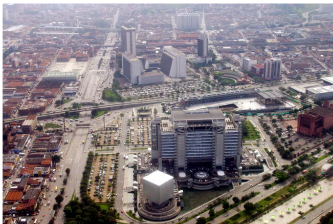
El emblemático edificio inteligente en Medellín, sede principal de EPM - crédito Colprensa.

Empresas Públicas de Medellín (EPM) reportó que sus ingresos operacionales durante 2023, con corte al 31 de diciembre, fueron de $37,5 billones, lo que representó un incremento del 16% respecto a 2022.