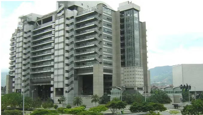
Edificio inteligente, sede de EPM.

El tercer segmento que más ingresos le representó a EPM fue el de la provisión y comercialización de agua, la gestión y comercialización de aguas residuales y la gestión y comercialización de residuos sólidos, con 10%, es decir, $9,9 billones de pesos.