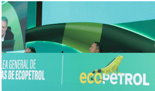
En la asamblea también se aprobó que por cada acción de Ecopetrol se entregará $278 por dividendos ordinarios, a los cuales se les sumó $34 por extraordinarios.

La idoneidad de los nuevos miembros de la junta sigue generando ruido, así como que Ecopetrol se convierta en una empresa de energía.