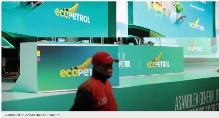
Asamblea de Accionistas de Ecopetrol

Este martes en la mañana la acción de Ecopetrol se desplomaba más de 5% en la Bolsa de Valores de Colombia, alcanzando un precio de $2.005. La razón: el mercado reacciona a la remezón en la Junta Directiva de la estatal