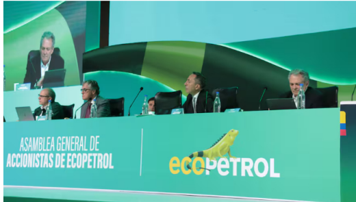
Los candidatos a la Junta Directiva de la petrolera han estado en la mira del ojo público por su baja experiencia en materia de hidrocarburos.

¡Gana hasta $312 por acción! Ecopetrol anuncia jugosos dividendos para 2024