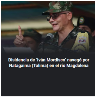
Disidencia de 'Iván Mordisco' navegó por Natagaima (Tolima) en el río Magdalena