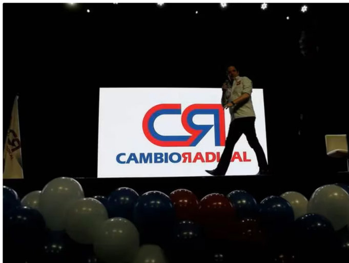
El partido político cuestionó la experiencia que Ángela María Robledo para estar en la junta directiva de Ecopetrol

El viernes 22 de marzo se dieron a conocer los nombres de las personas que harían parte de la nueva junta directiva de Ecopetrol para el periodo 2021-2025, entre estos individuos uno que llamó la atención fue el de la excongresista Ángela María Robledo, a la cual han cuestionado por redes que experiencia tiene para dicho cargo.