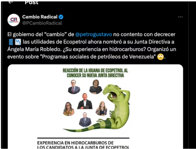
Cambio Radical criticó la experiencia de Ángela María Robledo para estar en junta directiva de Ecopetrol

Por su parte Ángela María Robledo, por medio de su cuenta de X a pesar de las críticas, hizo una publicación con respecto a su reciente nombramiento, y aseguró en esta que su llegada a la junta directiva de Ecopetrol ayudará a fortalecer el "rostro humano" de la empresa.