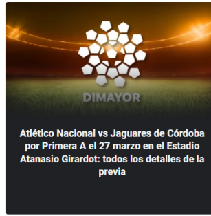
Atlético Nacional vs Jaguares de Córdoba por Primera A el 27 marzo en el Estadio Atanasio Girardot: todos los detalles de la previa

El fuerte reclamo de una hinchada del Junior de Barranquilla a Juanfer Quintero