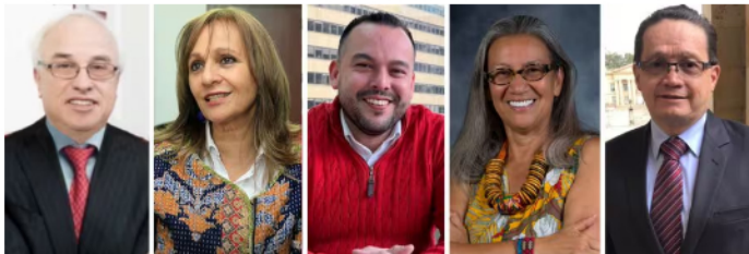
Nuevos miembros de la junta directiva de Ecopetrol .