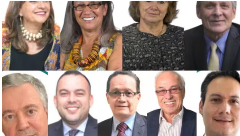
Nueva junta directiva de Ecopetrol.