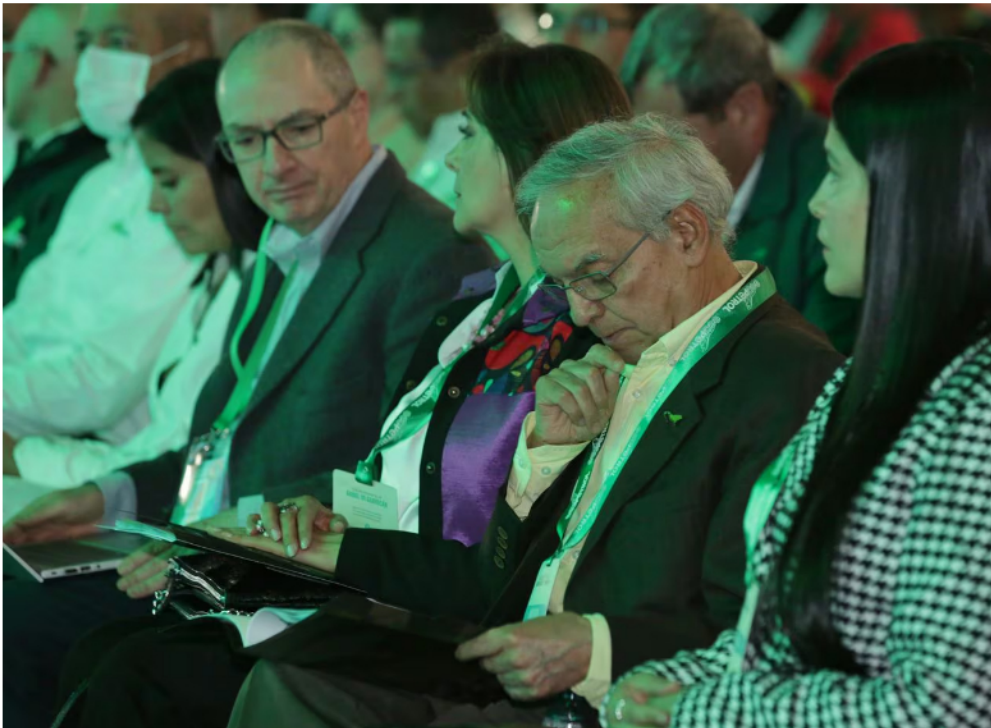
“El 1º de marzo era fuera de tiempo”, con lo cual, dijo Robledo, si se elige la junta sería invalidada.

La temperatura iba subiendo a medida que los accionistas tomaban al micrófono. El exsenador Jorge Robledo se hizo presente y contó a este medio sus preocupaciones. Compró un millón de pesos en acciones, en enero de este año, en parte, para poder tener derecho de participación en la asamblea, con lo cual, dijo: "es como volver a estar en la Comisión V del Senado de Nuevo" . Y así lo hizo. Se refirió a la gravedad de circunstancias como la de los tiempos en los que se presentaron las planchas. “El 1º de marzo era fuera de tiempo”, con lo cual, dijo Robledo, si se elige la junta sería invalidada.