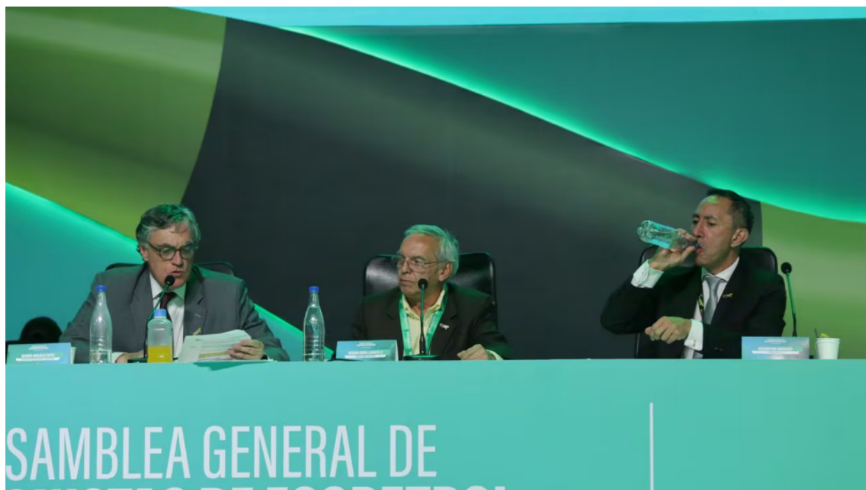
Asamblea General de Accionistas de Ecopetrol