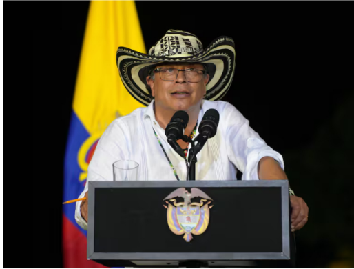
El presidente Petro cuestiona el manejo de la UNGRD y habla de replantear la entidad / Juan Diego Cano

El presidente sostuvo que se debe buscar una solución, para no acabar con el alma mater.